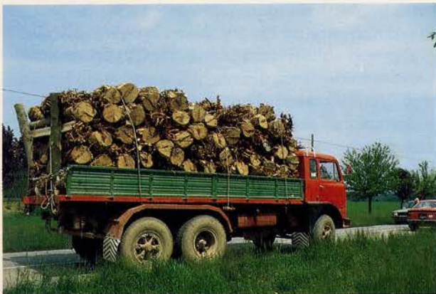
Fig. 7 - Trasporto delle ceppaie, estratte con cavaceppi, nelle fabbriche per la produzione di pannelli ricostituiti.

grammi produttivi a livello delle singole aziende e adeguare l'offerta alle richieste del mercato.