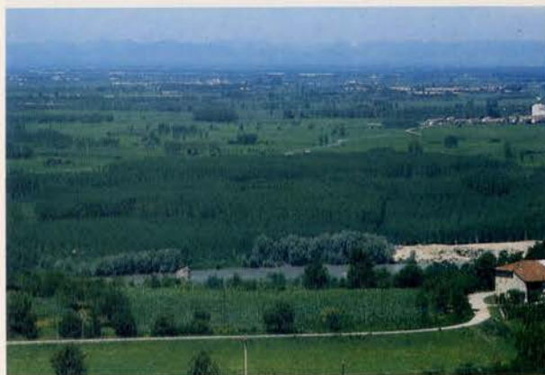
Fig. 1 - Veduta panoramica dalle colline del Monferrato sui pioppeti lungo il Po.

Il 'turno fisiocratico' coincide con l'anno di culminazione dell'incremento medio e quindi rende massima la produzione totale. Nella Pianura padana la culminazione per pioppeti di densità pari a 330 piante ad ettaro si ha frequentemente all'11° anno (PREVOSTO, 1965). Non è detto però che questo turno sia quello più conveniente per il pioppicoltore, soprattutto nei periodi di instabilità del mercato.