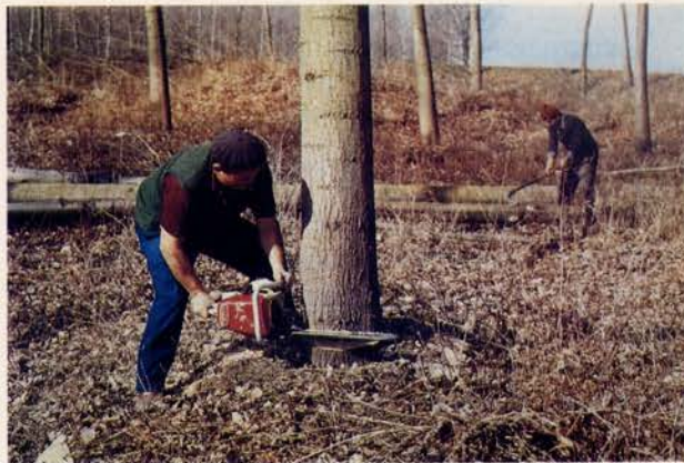
Fig. 4 - Abbattimento degli alberi con motosega.

In seguito i topi vengono accatastati disponendoli in andane, con la formazione di regolari mucchi, secondo i singoli assortimenti; le andane debbono essere sufficientemente distanziate per lasciare il passaggio libero agli autocarri singoli e ai rimorchi per il carico.