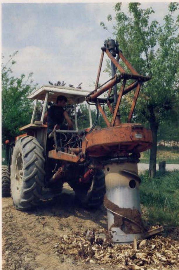
Fig. 6 - Estrazione delle ceppaie in campo con cavaceppi.

A questo primo passo fondamentale per ottenere una maggiore stabilità del mercato, ne potrebbero seguire altri finalizzati alla creazione di un vero e proprio processo di integrazione verticale tra i produttori e gli utilizzatori. Conoscendo cioè le reali esigenze qualitative e quantitative della domanda le associazioni di produttori potrebbero anche giungere a definire dei veri e propri pro-