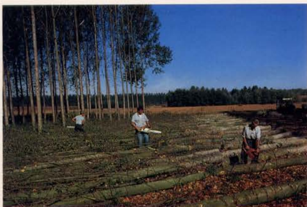
Fig. 5 - Depezzamento dei tronchi in topi per i vari assortimenti.

I tronchi vengono poi caricati sugli autocarri, a mezzo di appositi sollevatori, e trasportati in fabbrica.